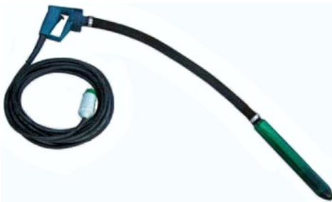
NCX S Stavvibrator med pistolgreb